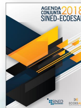
Agenda conjunta SINED-ECOESAD

Con el fin de distinguir las acciones en donde el SINED debe asumir el liderazgo, se elabora el PDI 2024. Por lo que se cubre un espacio de planeación necesario para impulsar las acciones claves del PIDESAD y de esa manera tener mas certeza en el desarrollo y consolidación de la ESaD.