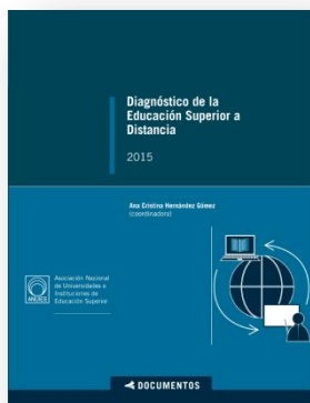
Diagnóstico de la Educación Superior a Distancia

Este diagnóstico se elaboró conjuntamente con la participación de 89 instituciones afiliadas a la ANUIES y explora diferentes interrogantes sobre las instituciones educativas de nivel superior que están ofertando programas de ESaD en México, y que refiere a los aspectos: ¿Cómo lo están haciendo?, ¿Con qué tecnología y recursos?, ¿Cuál es la vinculación con otras instituciones?, ¿Cuál es su prospectiva y principales retos a los que tendrán que enfrentarse?