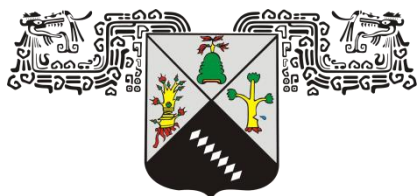
UNIVERSIDAD AUTÓNOMA DEL ESTADO DE MORELOS

Integrantes de la Comisión Coordinadora para la creación de la RIDDU: