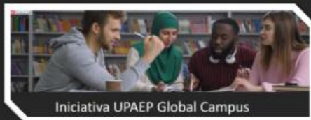
Iniciativa UPAEP Global Campus